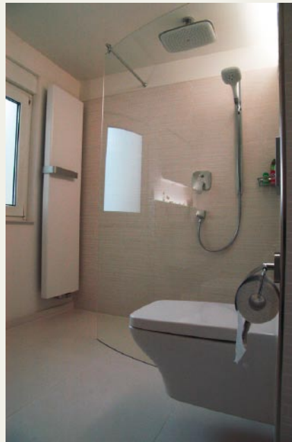
Die Toilette wurde bewusst nicht mit einem Sichtschutz versehen, um den Raum optisch nicht zu verkürzen.

Die Boden- und Wandgestaltung des Badezimmers ist natürlich auch ganz in Weiß gehalten. Wir spielen hier nur mit zwei Formaten. Der Boden wirkt mit großformatigen Feinsteinzeugfliesen (Serie „Black and White“ von Floor Gres) in 120 x 60 Zentimeter extrem weitläufig. Die wenigen, schmalen Fugen verschmelzen optisch mit den Bodenfliesen und vermitteln das Gefühl der Großzügigkeit. Auch der Duschbereich bindet sich in das Bodenbild ein. Die Wandgestaltung