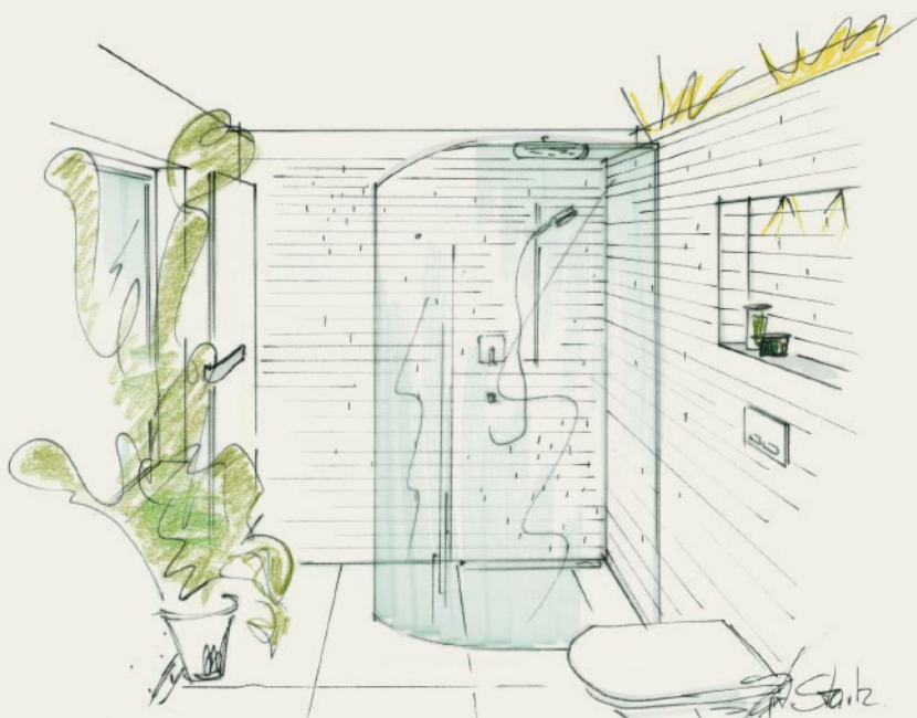
Die im Mauerverband verlegten Wandfliesen bilden einen starken Kontrast zu den großformatigen Bodenfliesen.

besteht durch die Verfliesung mit ebenfalls weißem Feinsteinzeug, dort allerdings im Mauerverband mit Rechteckmosaiken auf Netz. Hier sind viele und auch unregelmäßige Fugen bewusst in Szene gesetzt, um die Wirkung von Mauerwerk noch zu betonen. Die Ecke um die Dusche herum und die halbe Wand hinter dem Waschtisch wurden damit verkleidet, die restlichen Wände sind mit einem Wischsockel