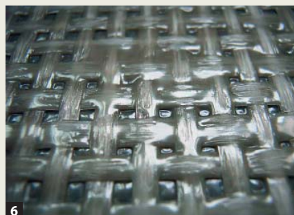
6 Das Foto zeigt die Nahaufnahme einer sehr glatten rückseitigen Beschichtung einer „Kerlite-Platte“ von Cotto d'Este. In diesem Fall sollte der Verlegemörtel mit einer Flüssigdispersion vergütet werden.