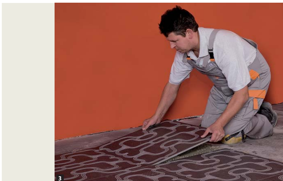
3 Eine gute Untergrundvorbereitung ist für die Ebenflächigkeit des Belags mitentscheidend.

Die technisch sicherste, wenn auch aufwendigste Methode ist das Auftragen einer Epoxidharzgrundierung. Damit kann eine Feuchtigkeitssperre zum Schutz des calciumsulfatgebundenen Untergrunds gewährleistet werden. Die Reaktionsharzgrundierung ist im frischen Zustand mit feuergetrocknetem Quarzsand der Körnung 0,3 bis 0,8 Millimeter abzustreuen, um eine einwandfreie Verbundhaftung des zementären Verlegemörtels zu ermöglichen. Diese Vorgehensweise bietet die größtmögliche Sicherheit.