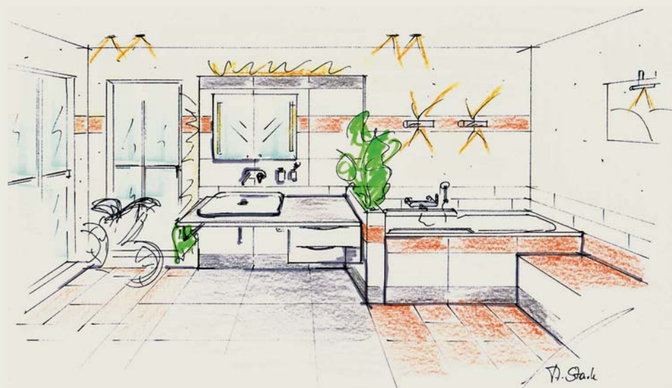
Der Waschtisch ist unterfahrbar und die Badewanne mit zusätzlichen Griffsystemen ausgestattet.

che, die sich jederzeit unproblematisch verändern lassen. Die rostfarbene Bordüre wird im Format 15 x 60 Zentimeter in Augenhöhe komplett an den Wänden herumgeführt und verbindet so den Raum zu einer Einheit. Eine optimale Wirkung wird erzielt, wenn die streichfähigen Flächen fliesenbündig – zum Beispiel mit Rigips - angearbeitet werden.