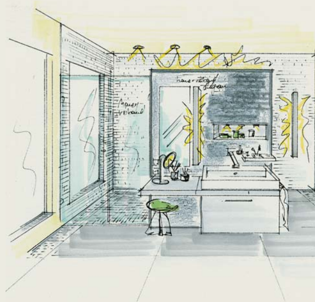
Eine optimale Lichtplanung ist ein wesentlicher Bestandteil für die Funktionalität und die Atmosphäre eines Bads. In den Zeichnungen sind die jeweiligen Lichtelemente

tion als Brausestange, der waagerechte Griff dient als Halteelement für den Einhängesitz. Optisch gelungen in ruhigen geometrischen Formen und wählbar in Farbe der Armaturen verwandelt sich hier ein überaus funktionelles Element in ein Gestaltungselement – und vermittelt somit nicht den Eindruck einer Stützhilfe für bewegungseingeschränkte Menschen.